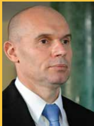
准备采用最先进的解决方案。