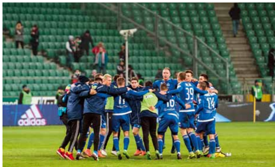
训练前球员和教练会议

采矿业不是一切，但如果没有采矿业，其他都不复存在 - 这是德国著名物理学家诺贝尔奖得主马克斯·普朗克，在一个多世纪前所说的话。我很高兴能向现代矿工亲爱的读者朋友们介绍足球俱乐部的历史，这是波兰和西里西亚体育运动的传奇。