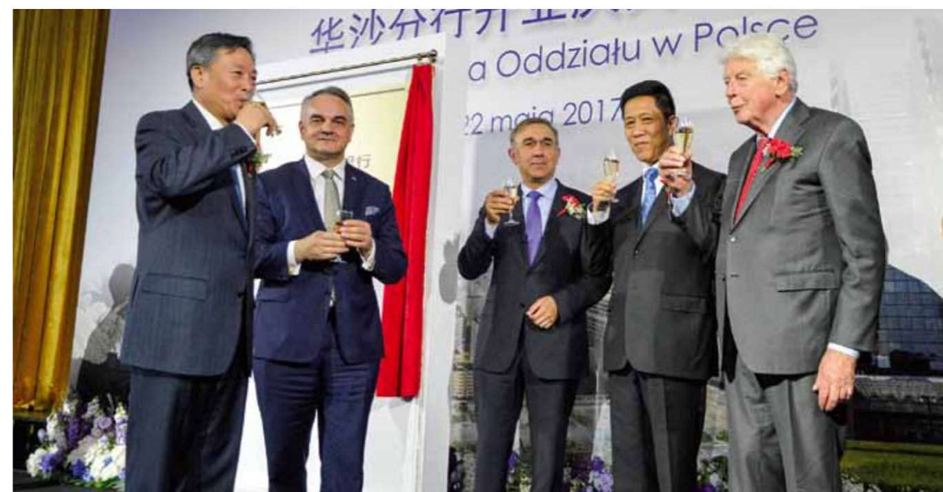
为中国建设银行的繁荣而干杯