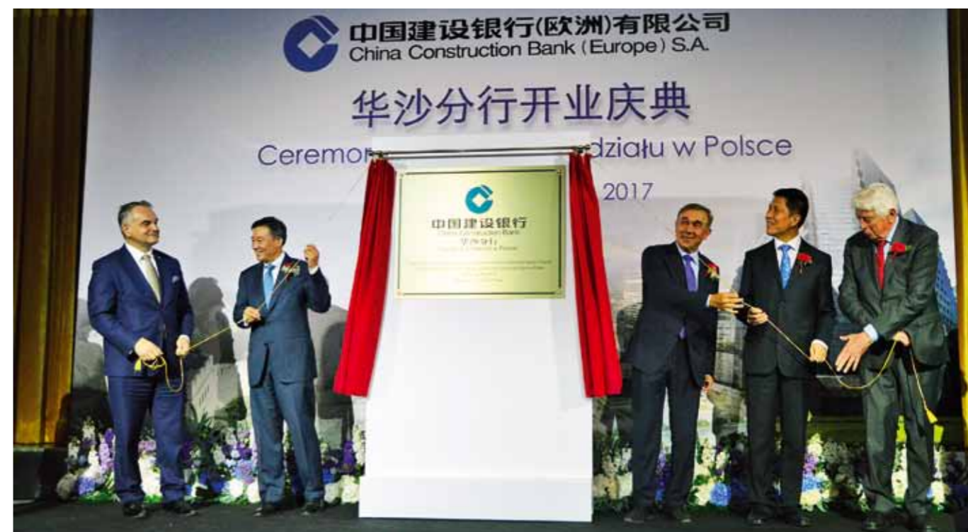
中国建设银行在波兰开设分行表明，良好的政治接触也就意味着非常良好的经济往来