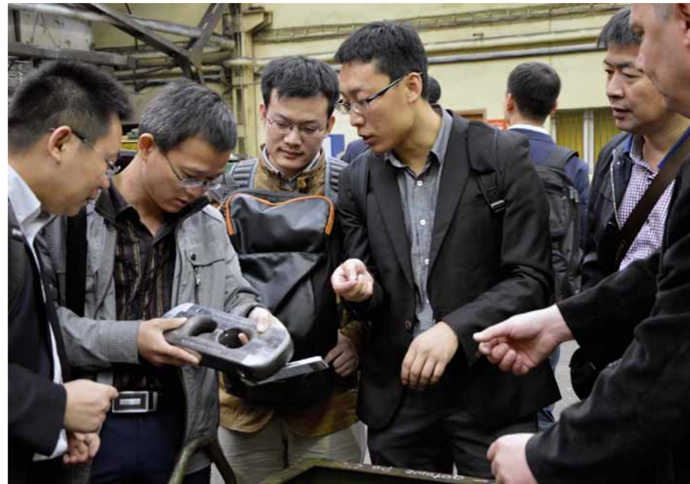
中国科学家了解华星集团卡托维兹工厂的创新产品