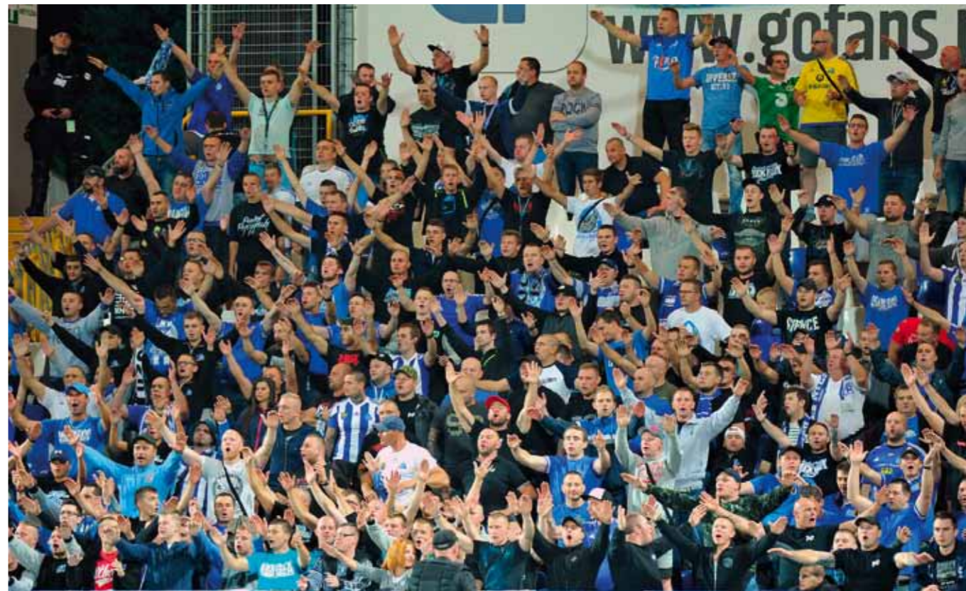
霍茹夫鲁赫足球俱乐部的球迷们在一场比赛中都为球员们加油助威