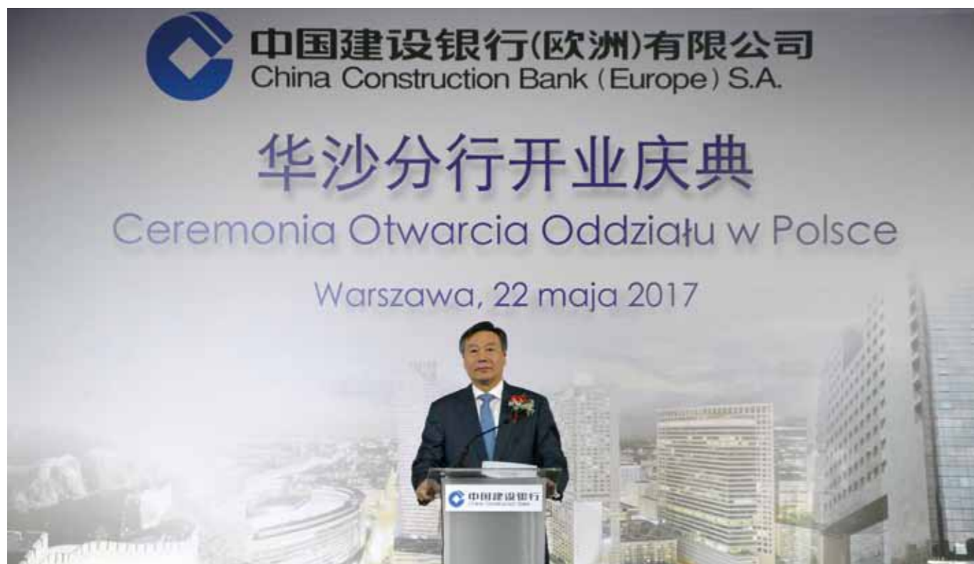
中国建设银行行长王祖继先生在讲话中强调了中波合作在落实“一带一路”中的重要地位

2017年5月22日，在华沙索菲特维多利亚酒店，举行了中国建设银行波兰华沙分行的开业庆祝活动。这是第三家认为波兰为优秀市场的中国银行。近年来，中国银行和中国工商银行相继在华沙开设了分行。