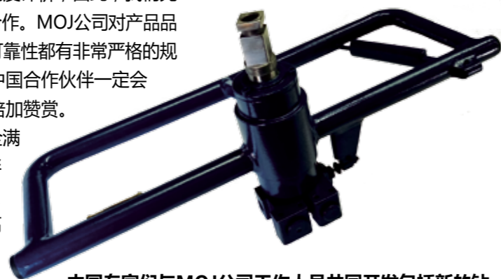
中国专家们与MOJ公司工作人员共同开发包括新的钻机扶手解决方案，现在已符合中国矿工的人体工程学。

伴对此也予以高度评价，因此，我们完全有机会扩大合作。MOJ公司对产品品质，创新性，可靠性都有非常严格的规定。我相信，中国合作伙伴一定会对我们的努力倍加赞赏。我们的产品完全满足中国合作伙伴对安全生产的关切，并且对提高工作效率非常有帮助。