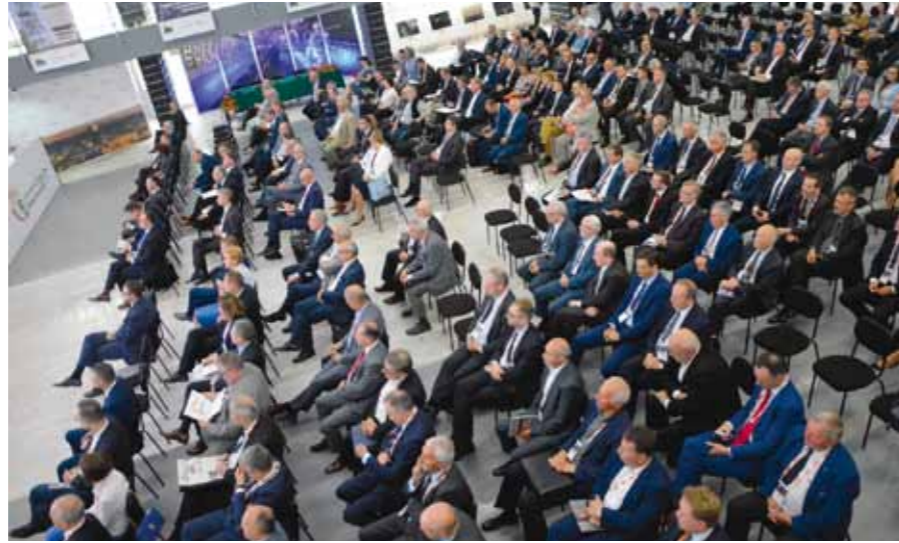
实施煤炭开采创新技术的从业者和科学家们参与了讨论会

经由生产过程的自动化，信息化和实时监控提高效率。预测可能的自然灾害。精准确定什么时候需要维修最重要的机器和设备。工程师们根据获取到的