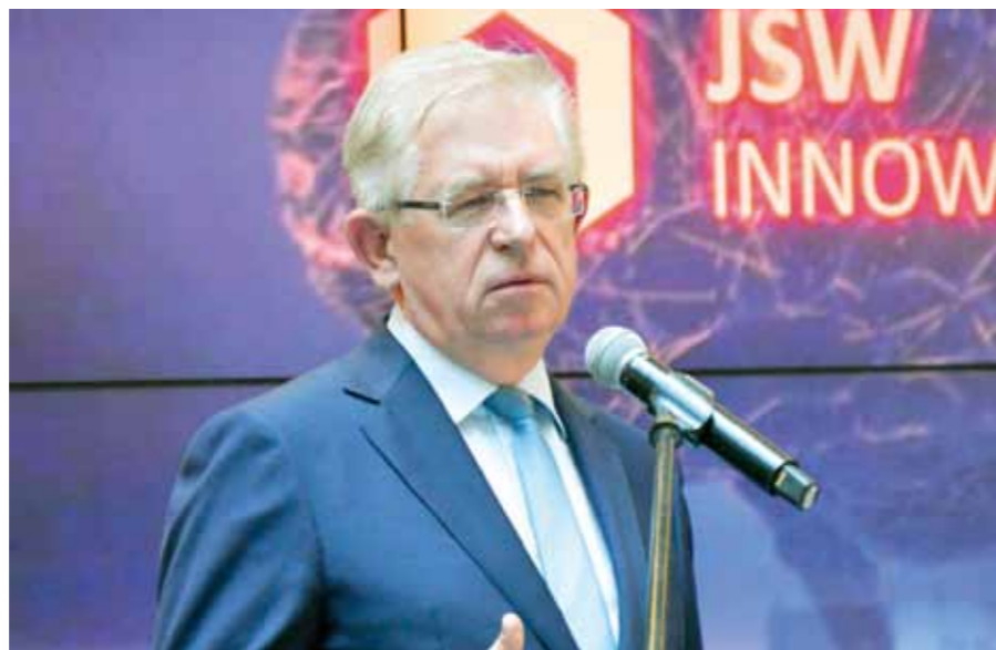
雅什申别煤业集团创新公司总部举行国际矿业论坛总结会

我经常听到这样的问题：这值得我们做吗？我谨举一个例子来回答这个问题。洗煤厂由于引入创新解决方案，产品质量提高1%，在一年内将获得额外